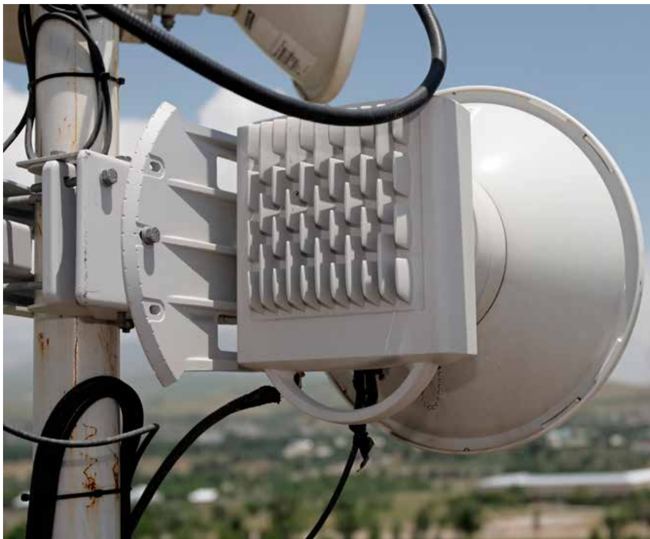
Antenn för datatrafik via fast yttäckande radioaccess, Fixed Wireless Access (FWA). (OBS! Extern produkt, ej InCoax.)